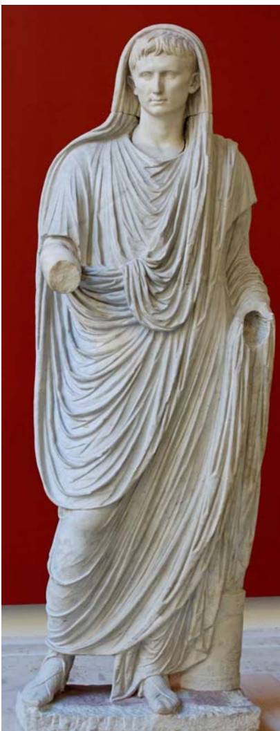
Toga-Statue des Augustus aus einer Villa der Livia an der Via Labicana, einer antiken Straße bei Rom.

Unter den Bürgern im antiken Rom gehört es zu den gesellschaftlichen Gepflogenheiten, dass das Familienoberhaupt die eigenen Angehörigen verheiratet. Augustus benutzt diese Tradition als ein Werkzeug, um die errungene Stellung seiner Familie zu sichern. Rigoros veranlasst er Scheidungen und Hochzeiten mit dem Ziel, einen Nachfolger aus dem Kreis der eigenen Familie bestimmen zu können. Zudem bindet Augustus Vertreter der Oberschicht, die ihm wohlgesonnen sind, auf diese Weise an sich. Zu ihnen zählt auch Publius Quinctilius Varus. Er heiratet erst eine Tochter des Agrippa, dem engsten politischen Berater des Kaisers, und im Jahr 7 n. Chr. eine Großnichte des Augustus. Von der ersten Ehe berichtet uns heute ein Fragment der Leichenrede, die der Imperator zu Ehren seines Freundes Agrippa im Jahr 12 v. Chr. gehalten hat. Dort wird Varus als Schwiegersohn von Agrippa benannt.