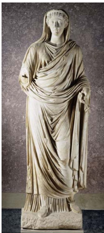
Statue der Livia, dritte Ehefrau des Augustus, aus Veleia.