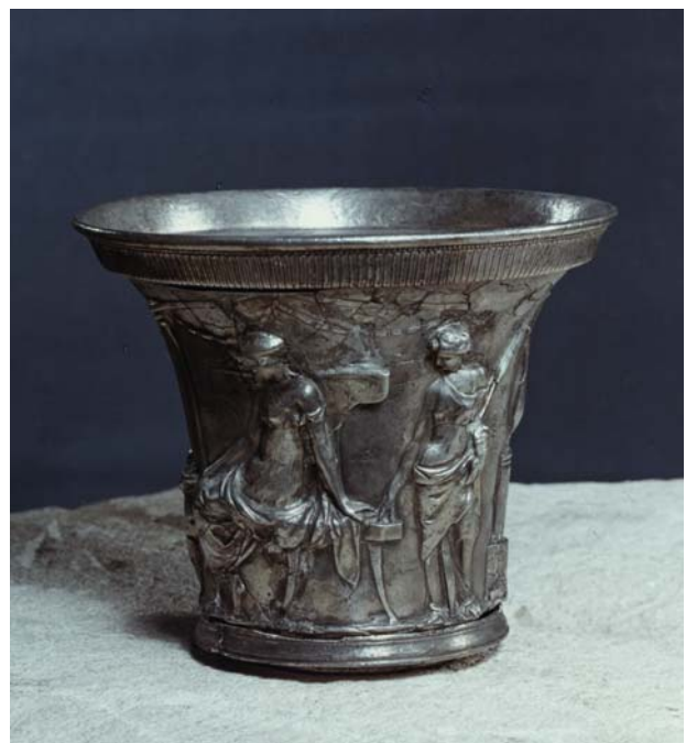
So genannter Hochzeitsbecher aus Xanten: Die Eheschließung von Jason und Kreusa, womöglich eine Anspielung auf Tiberius und Julia.

Julia stirbt Jahre danach im Exil. Die Beisetzung im Familienmausoleum hatte Augustus verhindert. Nach dem Tod des Herrschers am 19. August 14 n. Chr. tritt Tiberius dessen Erbe an. Augustus skrupellose Heirats- und Nachfolgepolitik ist damit gescheitert. Alle von ihm favorisierten Nachfolger sind vor ihm gestorben. Mit Tiberius wird sein Stiefsohn – das leibliche Kind seiner dritten Frau Livia – sein Nachfolger. Livia war 51 Jahre lang mit Augustus (früher Octavian) verheiratet. Ein Kind bekamen sie aber nicht.