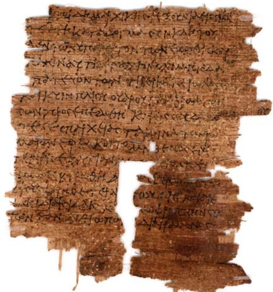
Papyrus mit Fragment der Leichenrede des Augustus auf Agrippa (12 v. Chr.). Papyrussammlung.

Unter Kaiser Augustus befand sich das Römische Reich vor 2000 Jahren auf dem Höhepunkt seiner Macht. Den Aufstieg Roms zur Weltmacht, die über den gesamten Mittelmeerraum herrschte, zeigt das LWL-Römermuseum in Haltern am See in der neuen Ausstellung „IMPERIUM“ (16.5.-11.10.). Die Schau des Landschaftsverbandes Westfalen-Lippe (LWL) ist Teil des Ausstellungsprojektes „IMPERIUM KONFLIKT MYTHOS. 2000 Jahre Varusschlacht“. Sie beleuchtet die politischen Leistungen des Augustus und die kulturelle Blüte seines „Goldenen Zeitalters“. Vom Verlierer der Schlacht im Teutoburger Wald zeichnet die Ausstellung ein Bild, das mit dem verbreiteten Versager-Image des Publius Quinctilius Varus aufräumt.