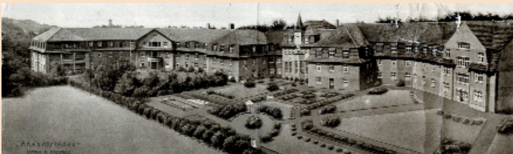
Das Haus Abendfrieden wurde 1920 in Betrieb genommen