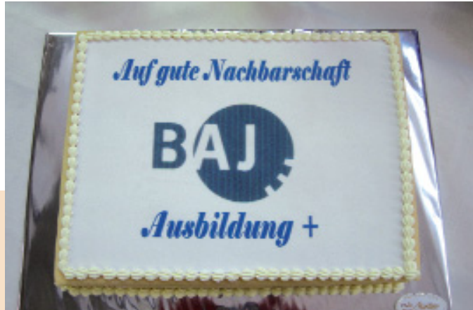
Marzipantorte – herzliche Begrüßung der neuen Kolleginnen und Kollegen

Wer aus eigener Erfahrung weiß, was ein Umzug im privaten Umfeld bedeutet, kann vielleicht ermessen, das der Umzug von vier Ausbildungsbereichen und dem Bereich Sozialdienst eine immense logistische Herausforderung