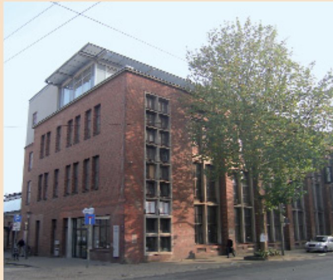
Berufliches Aus- und Weiterbildungszentrum „Dürkopp Tor 6“

mit verschiedenen Partnern hat sich mittlerweile eine feste Kooperationsstruktur entwickelt. Zu den Partnern gehören z.B. die GAB, INVIA, KurzUm, die Handwerksbildungszentren, der Potthoff-Verein, das VHS-Bildungswerk und die v. Bodelschwingschen Stiftungen Bethel. Seit 2010 bietet außerdem das „Berufskolleg am Tor 6“ insbesondere benachteiligten jungen Menschen neue schulische Lernmöglichkeiten.