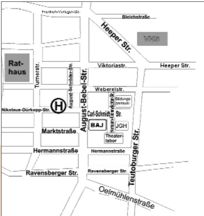
Anfahrtsskizze „Dürkopp Tor 6“

Kooperation mit dem BfW – Unternehmen für Bildung).