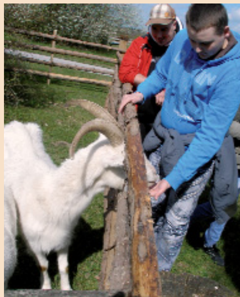
Ziegen zum Anfassen

Unsere letzte Station war das Paderborner Dorf. Dort kehrten wir in die Bäckerei ein, wo auch für das Korn bzw. Mehl Endstation war. In der Bäckerei bekamen wir von einer netten Verkäuferin einen Laib Brot zum Probieren überreicht. Wer wollte, konnte sich dort mit herrlich duftenden Backwaren versorgen.