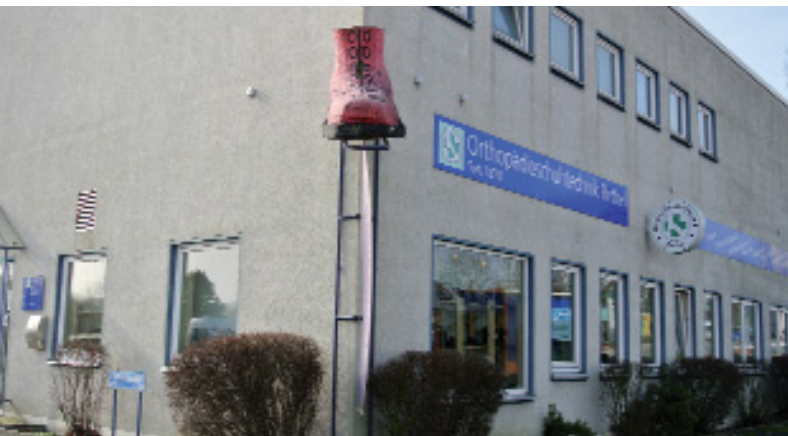
Orthopädiewerkstatt An der Tonkuhle in Bethel

ein ganz normaler Betrieb“, erläutert sie.