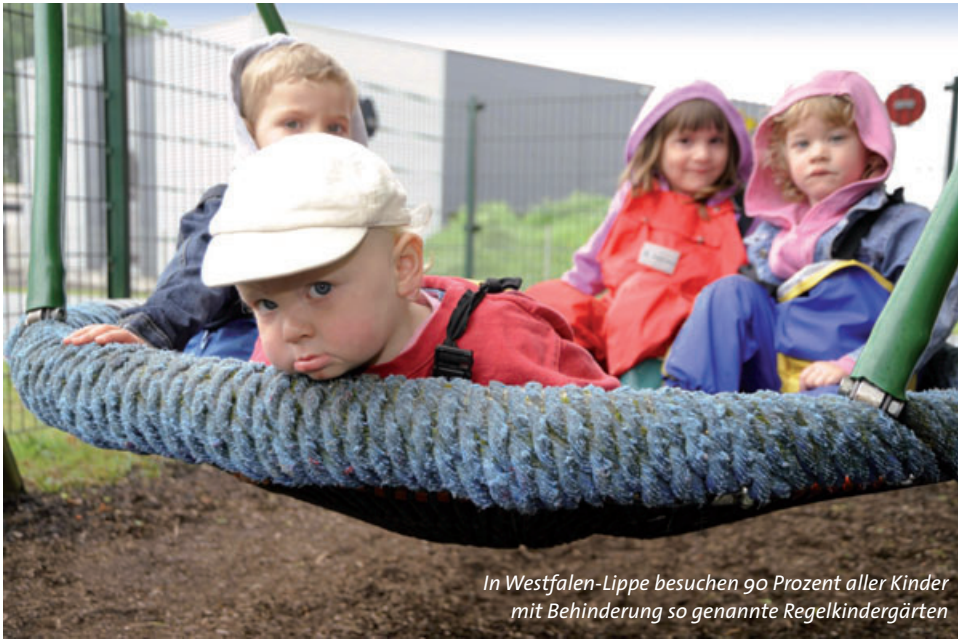
In Westfalen-Lippe besuchen 90 Prozent aller Kinder mit Behinderung so genannte Regelkindergärten