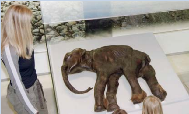
Star der Klima-Ausstellung ist das Mammutbaby „Dima“, das vor rund 35.000 Jahren in Sibirien starb.

über den Motor der Evolution – das Klima. Mehr als 800 Ausstellungsstücke aus allen Kontinenten, darunter das weltbekannte Mammutbaby „Dima“, machen sowohl die Anpassungsfähigkeit der Menschen, Tiere und Pflanzen über die Jahrtausende als auch die Wetterextreme vor sechs Millionen Jahren bis zu zukünftigen Hochwasserkatastrophen erlebbar.