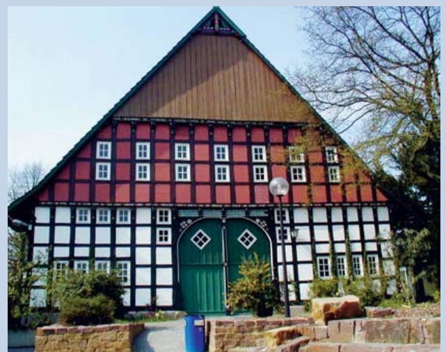
Der Jugendhof Vlotho wird 60 Jahre alt.