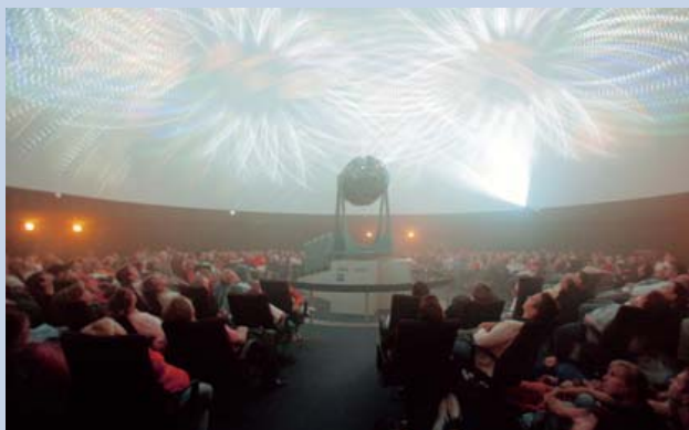
360°-Aufnahmen, 9.000 Fixsterne und eine Kuppel von 20 Metern Durchmesser: Das Planetarium in Münster öffnet Gästen die Augen.

Das Planetarium im LWL-Museum für Naturkunde am Aasee feiert sein 25-jähriges Bestehen. In den vergangenen 25 Jahren haben etwa 2,7 Millionen Besucherinnen und Besucher im Museumsplanetarium die Sterne bewundert.