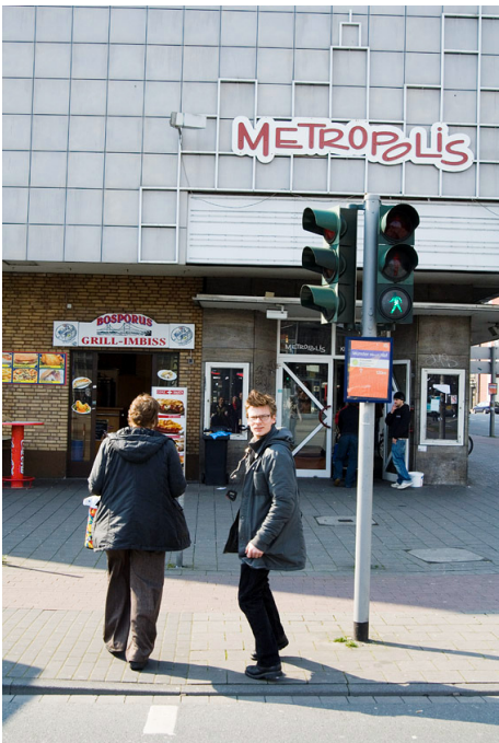
Kino Metropolis, außen