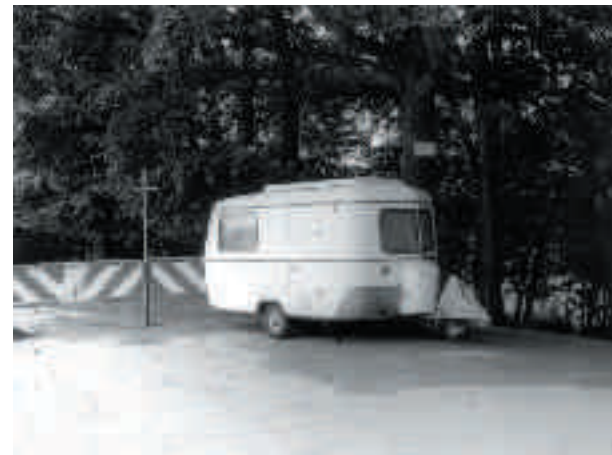
LWL-Landesmuseum für Kunst und Kulturgeschichte