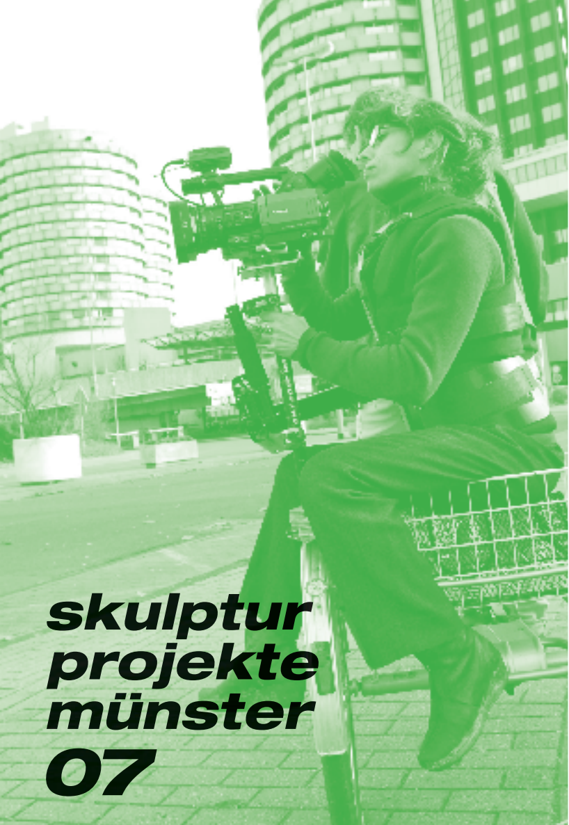
Roman Mensing / sp07