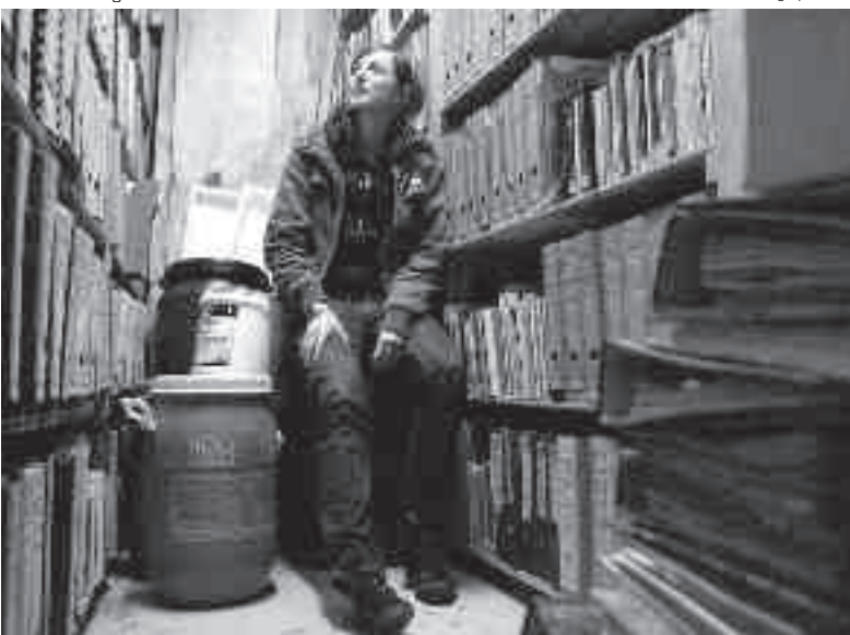
Roman Mensing / sp07