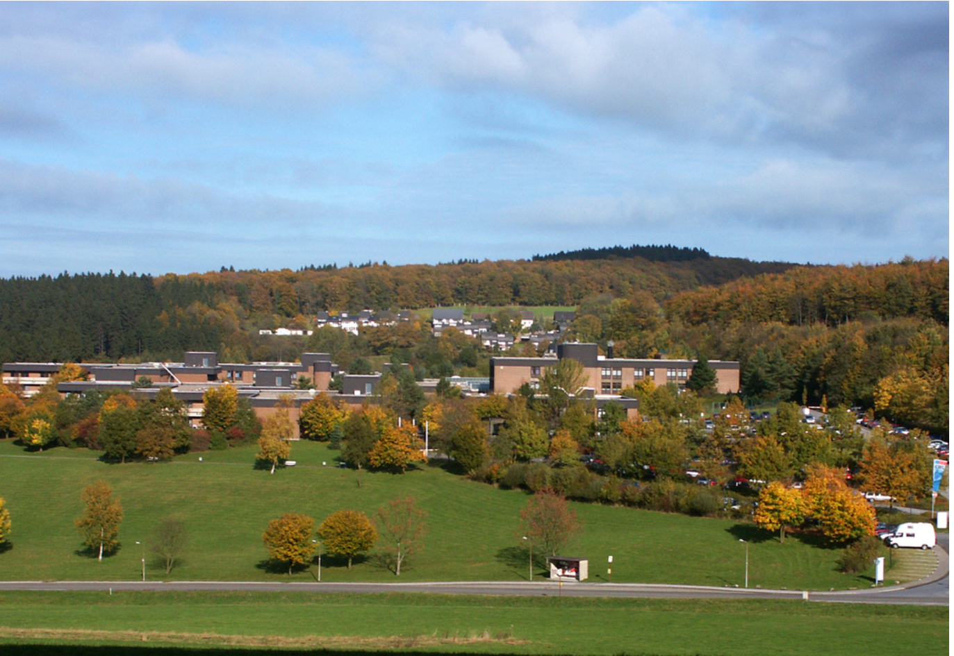
Abbildung: Ansicht der Klinik

Die LWL-Klinik Hemer - Hans-Prinzhorn-Klinik ist ein Fachkrankenhaus für Psychiatrie und Psychotherapie mit Aufgaben psychiatrischer Pflicht- und Vollversorgung für den nördlichen Märkischen Kreis und den südlichen Ennepe-Ruhr-Kreis. Dass Patienten sich bei uns wohl fühlen, zeigt unser großer Einzugsbereich. Träger der Klinik ist der Landschaftsverband Westfalen-Lippe. Die Klinik ist reizvoll gelegen und großzügig gestaltet.