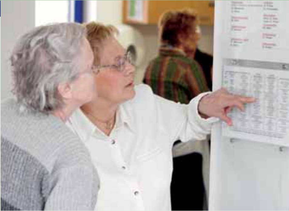
▲ Der Therapieplan bietet Orientierung.