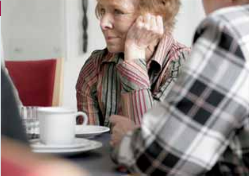
▲ Die Geborgenheit in der Gruppe der Tagesklinik füllt die innere Leere aus.