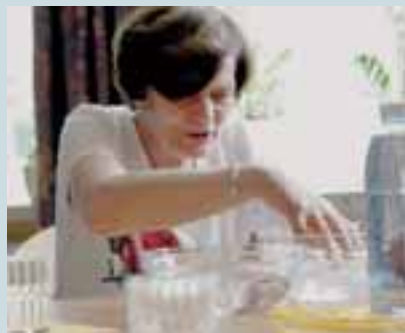
▲ Die Berührung mit Wasser spricht die Sinne an und weckt vielfältige Assoziationen.

Die „kleine Schule des Genießens“ übt das bewusste Wahrnehmen und Genießen über die Sinne. Es werden Duftöle gerochen oder Stoffe ertastet, um Erinnerungen wachzurufen. Der Duft von Orangen lässt zum Beispiel an Weihnachten denken, ein Seidenschal auf der Haut weckt vielleicht vergessene positive Gefühle. Höhepunkte des Genusstrainings sind Besuche in einem chinesischen Restaurant.