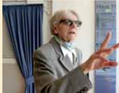
▲ An einem Impfstoff gegen Alzheimer wird gearbeitet.

Solche Beeinträchtigungen sind etwa: Störungen der Sprache, der räumlichen und zeitlichen Orientierung oder der Geschicklichkeit. Hinzu können Stimmungsw