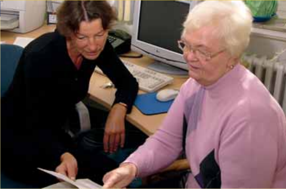
▲ Die Mitarbeiterin eines Sozialdienstes (li.) berät eine Patientin vor deren stationärer Behandlung.