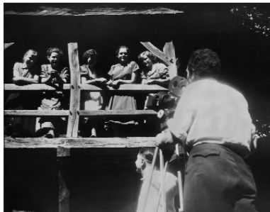
Der Filmemacher Kramer in Aktion

Sagst Du's mir, so vergesse ich es Zeigst Du es mir, so merke ich es mir vielleicht. Lässt Du mich teilhaben, so verstehe ich es. (Chinesisches Sprichwort)