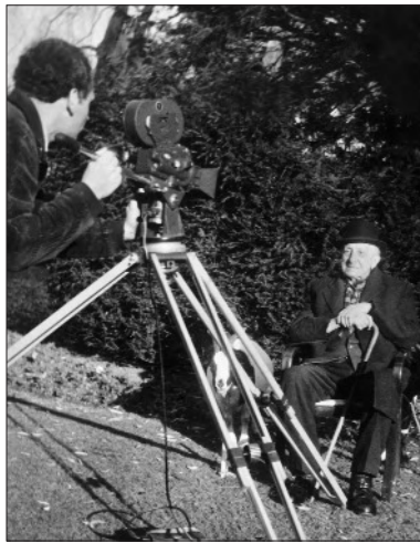
Der Filmmacher bei Dreharbeiten zum Film „Westfalenspiegel“

Die 1950er Jahre waren ein Jahrzehnt der Gegensätze. Der Zweite Weltkrieg war erst seit wenigen Jahren vorüber, die Menschen wollten die Schrecken und Entbehrungen vergessen und nicht über Ursachen und Folgen nachdenken, sondern endlich wieder nach vorne in eine bessere, schönere Zukunft blicken. Vor diesem Hintergrund entwickelte sich dieses Jahrzehnt zu einer Ära von Enttrümmerung und Wirtschaftswunder. Auf der einen Seite standen Desillusionierung und Armut, die aus der Nachkriegszeit resultierten, und auf der anderen Seite wuchs neue Hoffnung, angefeuert durch die