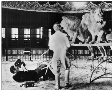
Dreharbeiten im Zirkus Barum