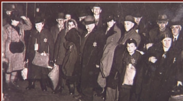
Männer, Frauen und Kinder warten in Coesfeld auf ihre Deportation.