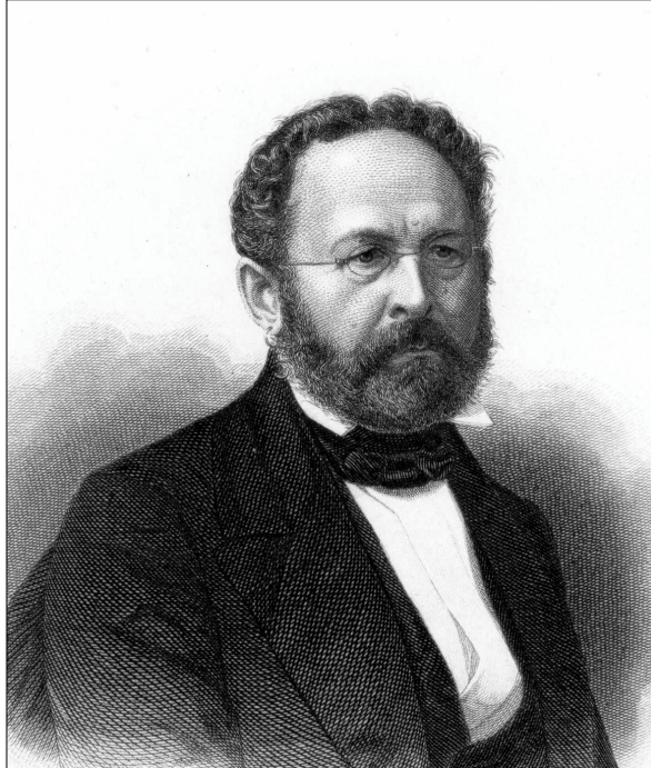
Jodocus Donatus Hubertus Temme

* 22. Oktober 1789 in Lette bei Clarholz (heute Oelde-Lette)