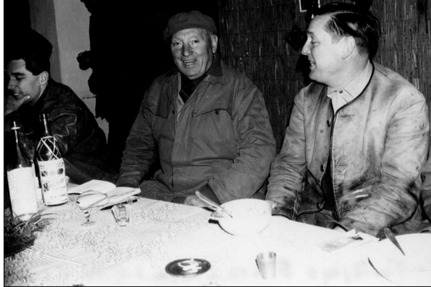
Treibjagd Enningerlob am 21. Dezember 1967