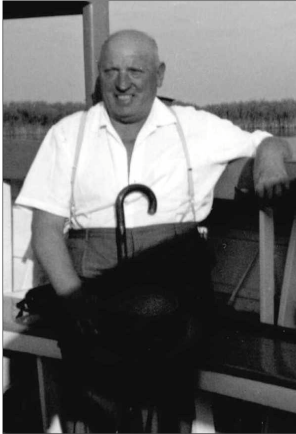
Neusiedler See, etwa 1963