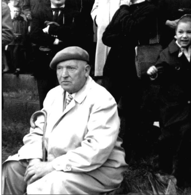
Maifeld – Berlin, 27. Mai 1965