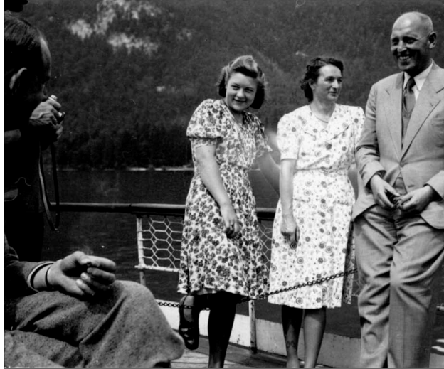
Am Wolfgangsee 1941