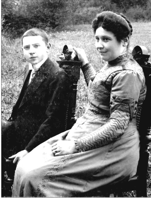
Der junge Rottendorf und seine Mutter