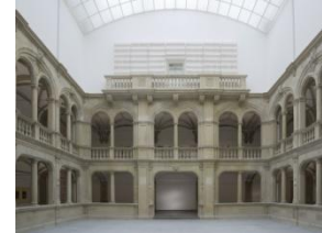
15_Blick in den Lichthof im Altbau des Museums