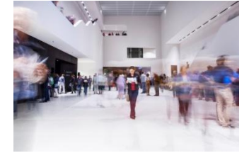
14_Besucher bei einer Veranstaltung im Foyer