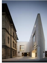
5_Altbau und Spitze am Abend