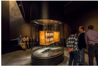
26_Kabinettschrank, sogenannter Wrangel- schrank, 1566