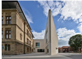
4_Nordfassade des Museums