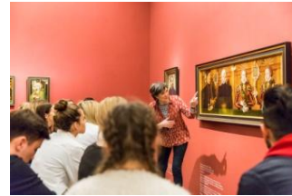
28_Besucher während einer Führung im Museum