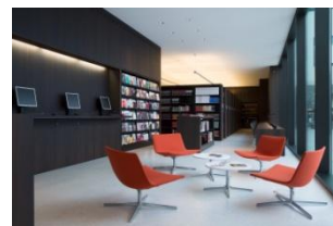
10_Die Museumsbibliothek