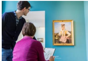
32_Zeichenworkshop für Erwachsene