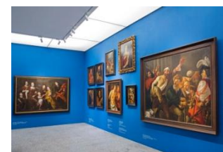
24_Blick in die Sammlung Barock