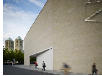
3_Blick auf Spitze und Dom von der Pferdegasse