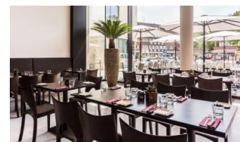
11_Das Museumscafé LUX