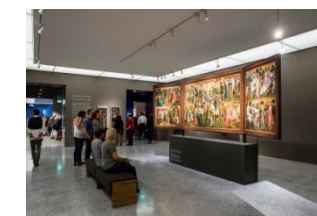
25_Besucher in der Sammlung