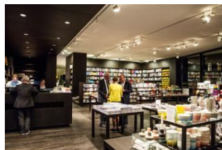
9_Der Museumsshop