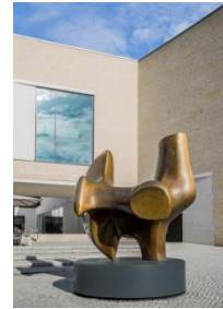
6_Henry Moore, Three Way Piece No. 2 (The Archer) © Reproduced by permission of The Henry Moore Foundation, Foto: LWL / Hanna Neander