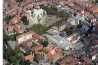
2_Luftaufnahme des Museums