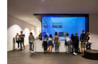
16_Blick in den Patio