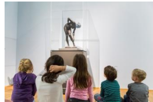
30_Führungen für Kinder