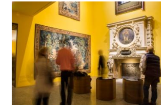
22_Barocker Kamin in der Sammlung