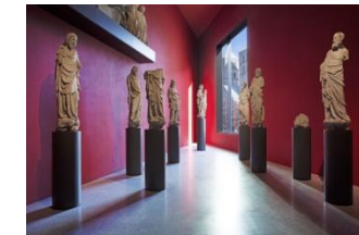
19_Die Überwasserskulpturen in der Spitze des Museums