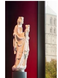
20_Die Madonna in der Spitze