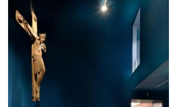
17_Bockhorster Triumphkreuz, Ende 12. Jahrhundert