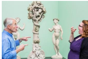
29_Führungen in Gebärdensprache