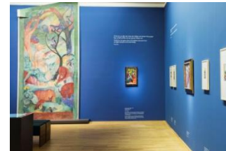
21_August Macke ist im LWL- Museum ein eigener Ausstellungsraum gewidmet .