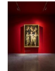
23_„Die drei Grazien“ von Dirk de Quade van Ravesteyn