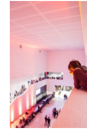
13_Lichtnacht im Foyer