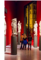
18_In der Spitze des Museums