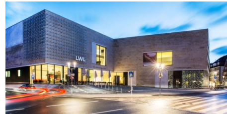
8_Museum am Abend