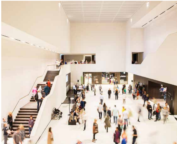
Blick in das Museumsfoyer.

Das Kunstgespräch nimmt Highlights der Sammlung vom Mittelalter bis zur Gegenwartskunst in den Fokus.