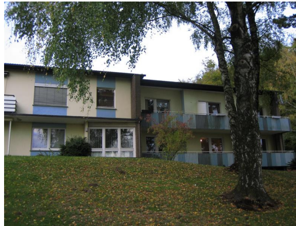
Wohngruppe „Neinstedter Weg“

abstinentes Wohnen mit enger Mitarbeiteranbindung