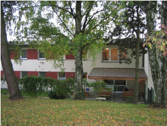
HPI- Weserland 1