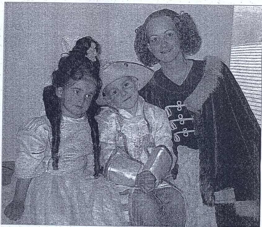
Kleider und Perücken machen Leute: Lady Kärin von Jason genossen es in Dalheim, in ein längst und zu Wostbrock mit Edelfräulein Joana und Junker vergangenes Jahrhundert einzutauchen.

Gut gestärkt lohnte denn doch ein Spaziergang zum Refektorium, wo die historische Tanzgruppe