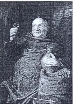
Dieser „Bruder Kellermeister“ steht sinnbildlich für ein Stück Klosterkultur.

In den mit Rücksicht auf die Patina des alten Gemäuers modernisierten Ausstellungsräumen finden sich auf 980 Quadratmetern rund 240 Exponate. In der früheren Räucherammer, deren Wände noch pottschwarz sind, schauen den Besucher ehrwürdige Äbte und Äbtissinnen aus alter Zeit an. Reich bestickte Messgewänder und ein fast wie neu wirkendes Antependium zeigen die handwerkliche Kunst und den Glanz der Barockzeit ebenso wie kostbares liturgisches Gerät vom Kelch bis zum Weihrauchfass. Zusätzlich geben Video- und Hörstationen Auskunft über klösterliches Leben früher und heute.