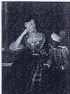
Porträt einer Äbtissin in der Ausstellung „Barocke Blütezeit“

Nach der Jahrtausendwende entstand dann die Idee zu einem Klostermuseum. Um den politischen Bedenken entgegenzuwirken, der LWL wolle als Tribut an das katholische Paderborner Land ein Religionsmuseum finanzieren,