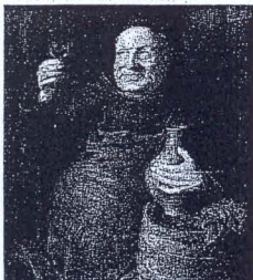
Dieser „Bruder Kellermeister“ steht sinnbildlich für ein Stück Klosterkultur.