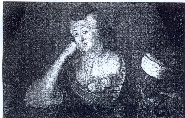
Fromm, aber adelig: Die Haforder Äbtissin Johanna Charlotte von Anhalt-Dessau demonstrierte ihre Vorliebe, indem sie sich mit einem inneren Mehren porträtieren ließ.

ren Betrieb aufgenommen - gut sichtbar für den Museumsbesucher, der das Dalheimer Kloster-