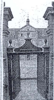
Durchblicke: Das barocke Aposteltor.