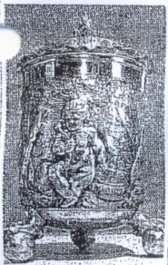
Besonders: Die Konfektiose, die heute noch als Wahlurne dient.

Einen Einblick, welche Pflanzen und Kräuter einst in Klostergärten kultiviert wurden, gibt der rekonstruierte barocke Konventgarten. Heil-, Nutz- und Symbolpflanzen, von denen sich noch manche in heutigen Hausgärten finden, wurden in zahlreichen Beeten angepflanzt. Dem irdischen Garten korrespondieren die himmlischen Gärten von Kloster Dalheim, 500 Jahre alte Deckenmalereien in Kirche und Kreuzgang.