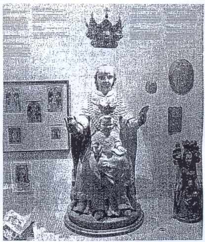
Wundersam: Schon zur Zeit des Barock wurde das mittelalterliche Werler Gnadensbild kopiert. Man sprach ihm Wunderwirkungen zu.

„Die Seele nährt sich von dem, woran sie sich erfreut“, schrieb gleichfalls Augustinus. Doch in Dalheim muss auch der Leib nicht darben. Die Brauerei hat in den Kellern nach etlichen Jahrhunderten Pause wieder ih-