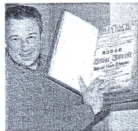
Aus der Klosterbibliothek stammt diese Bibel – und dahin kehrt sie nun zurück

Das beeindruckendste Exponat klösterlicher Kultur in Westfalen bleibt jedoch das Augustinerstift selbst: spätgotisch zeitlos – mit barockem Charme. Es ist ein steinerne, doch „sprechende“ Zeuge einer klösterlichen Blütezeit in Westfalen..