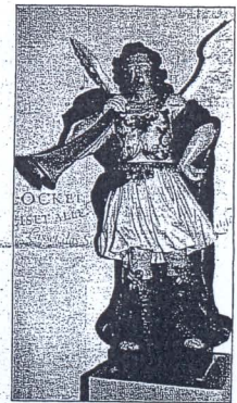
Orgelschmuck aus der Barockzeit: ein Fanfaaren-Engel aus dem Kloster Dalheim.

Es waren Augustiner Chorherren, die vom frühen 15. Jahrhundert bis zur Säkularisation das Kloster Dalheim geleitet und zu einem florierenden Wirtschaftsunternehmen ausgebaut hatten.