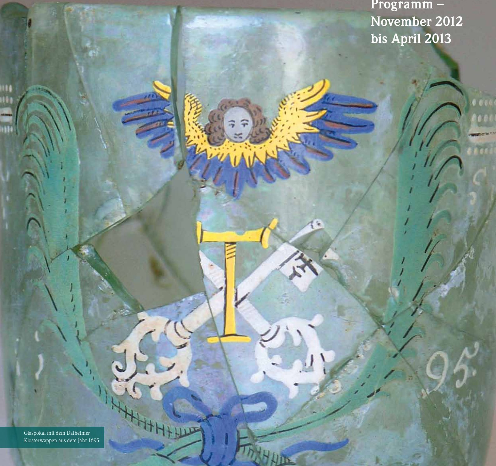
Glaspokal mit dem Dalheimer Klosterwappen aus dem Jahr 1695