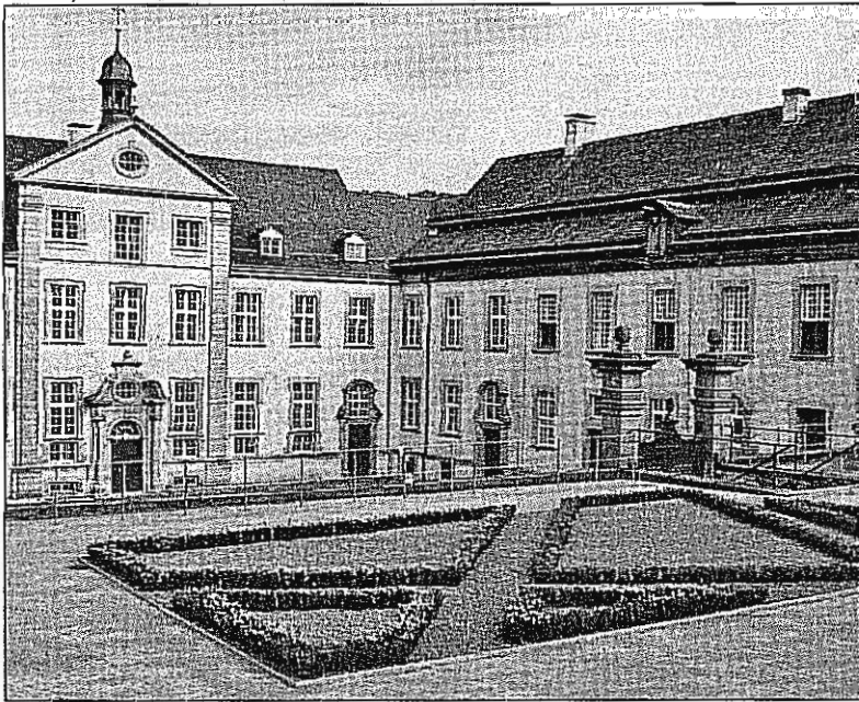
Die Vorderansicht des ehemaligen Augustinerklosters in Lichtenau-Dalheim

Kunst und Kultur der Benediktiner – aus Kärnten stammt die erste Sonderausstellung, die das „Landesmuseum für Klosterkultur“ in Lichtenau-Dalheim zeigt.