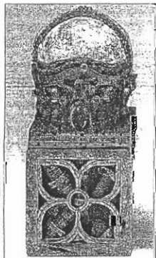
Ein so genanntes „redendes Reliquiar“ ist dieses „Heilige Haupt“ aus dem Diözesanmuseum Osnabrück.