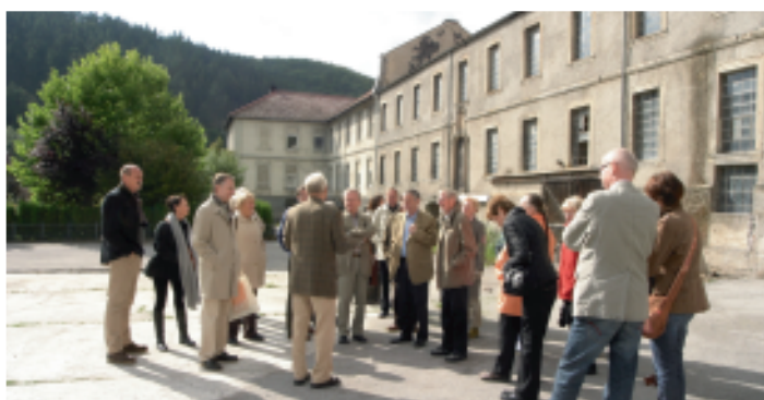
Klosterfreunde auf Entdeckungsreise in Bredelar.

Drei ehemalige Klöster im Dalheimer Umkreis nahmen 30 Vereinsmitglieder bei unserer ersten Klosterreise am Tag des offenen Denkmals 2008 in den Blick: Bredelar, Flechtdorf und Volkhardinghausen. Sie alle teilen ein Schicksal: Sie waren oder sind noch Ruinen. Zwei von ihnen – Bredelar und Flechtdorf – wurden in der jüngsten Vergangenheit von Freundeskreisen und Fördervereinen entdeckt und Dank ihrer Hilfe zu neuem Leben erweckt. Vertreter der Vereinsvorstände führten uns durch „ihre“ Anlagen, gewährten Einblicke in ihre Arbeit.