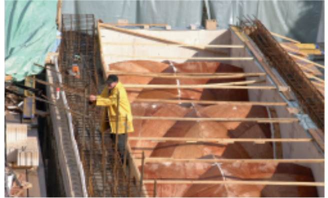
10/2008: Auf dieser Holzkonstruktion wurden die neuen Kreuzganggewölbe im Südflügel gegossen.