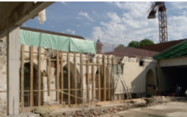
08/2008: Südlicher Gebäudeflügel. Die Rekonstruktion des fehlenden Kreuzgangflügels wird vorbereitet, die historische Außenmauer zum Schutz verkleidet.