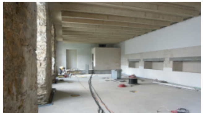
04/2009: Der neue Tagungsraum im EG Südflügel ist im Rohbau bereits fertiggestellt.