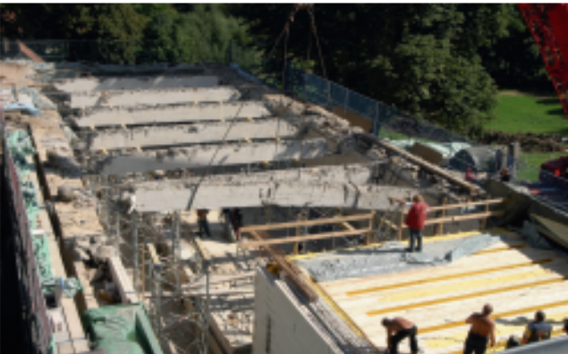
08/2008: Blick auf den südlichen Gebäudeflügel. Das OG ist abgetragen. Betonträger aus der Domänenzeit werden entfernt.