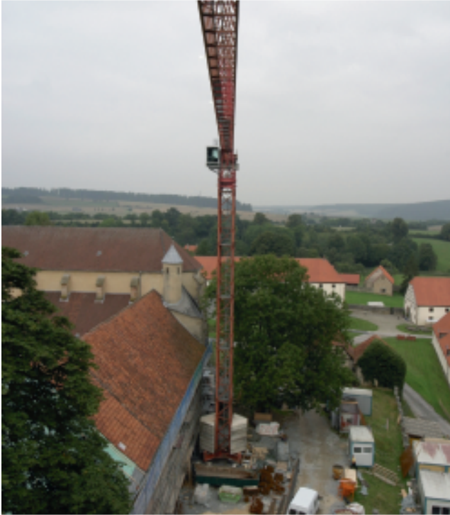
08/2008: Der Baukran wird montiert: 32,8 Meter hoch mit einem 60 Meter langen Ausleger.