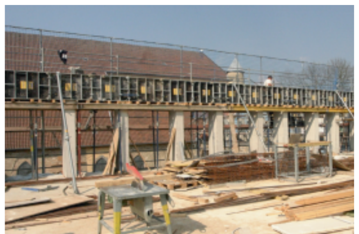
Hier erwächst die neue Empore im Südflügel.

Insgesamt sind derzeit bis zu zehn Gewerke auf der Klosterbaustelle beschäftigt mit mehr als 30 Handwerkern vom Restaurator über den Betonbauer und den Eisenflechter bis hin zum Heizungsmonteur.