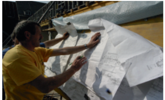
04/2009: Betonbauer bei der Planung im OG Südflügel.