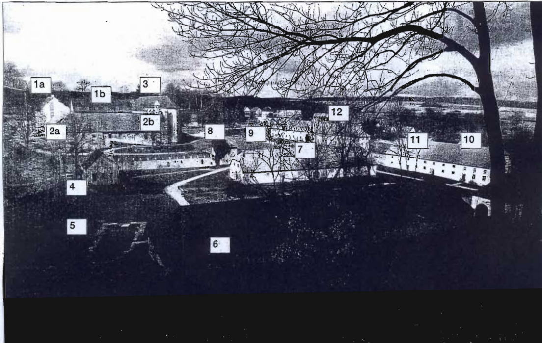
Das Ensemble der Dalheimer Gebäude: 1a: Gästeflügel, 1b: Westflügel, 2a: Südflügel, 2b: Ostflügel, 3: Nordflügel, 4: Mühle (in Betrieb), 5: Reste der Kirche der Augustinerinnen aus dem Mittelalter, 6: alter Schafstall (heute Materiallager), 7: neuer Schafstall (heute Veranstaltungsgebäude), 8: Geflügelhaus

Samstag/ Sonntag, 19./20. Januar 2007 (Seite 1 von 1)