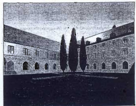
Der Kreuzhof im Jahr 2010 mit dem dann aufgestockten Südflügel (li.) und dem bereits vollständigen Westflügel. Simulationen (2): Architekten Pfeiffer-Eliemann-Preckel