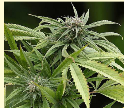
Der indische Hanf: eine blühende Cannabispflanze

Cannabiskonsum ist weit verbreitet. Obwohl Cannabis eine illegale Droge ist, haben rund ein Drittel aller 18- bis 24-Jährigen Erfahrungen mit „diesem Stoff“.