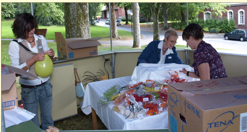
Aufbau der Tombola - seit Jahren fester Bestandteil des Ehemaligentreffens

„Laufen und joggen...und seine positive Auswirkungen auf die Psyche – auch im Rahmen einer Suchttherapie“. Anschließend wurde noch lebhaft über die Beiträge der beiden Referenten diskutiert.