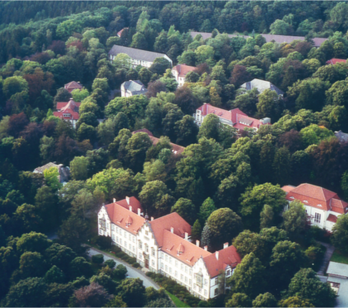
Abbildung: LWL-Klinik Warstein für Psychiatrie und Psychotherapie