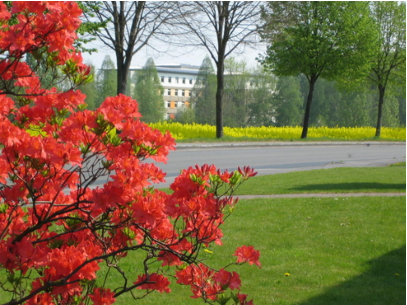
Abbildung: Die LWL-Klinik Lippstadt, Stadtteil Benninghausen

Die LWL-Klinik Lippstadt stellt sich vor