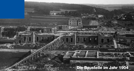
Die Baustelle im Jahr 1904