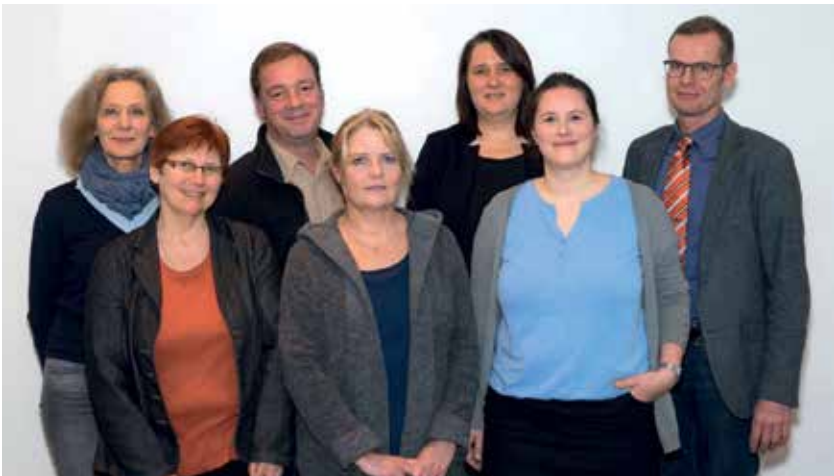
Das Team der Seniorentagesklinik