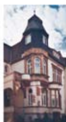
Tagesklinik Sucht Schwelingstraße 11