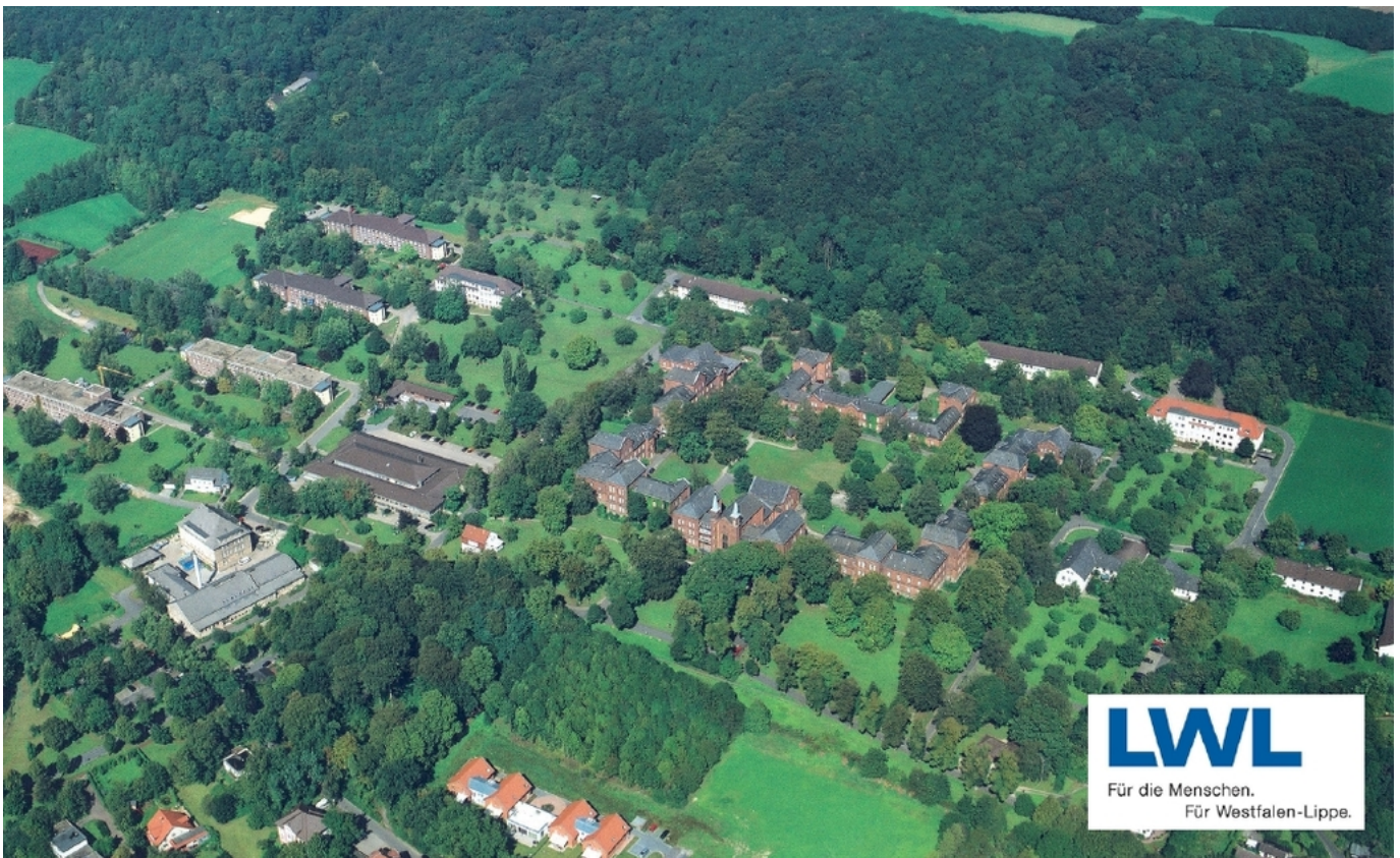
Abbildung: LWL-Klinik Lengerich