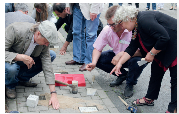
Grundsteinlegung am 31.05.17