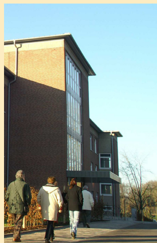
Eingang zu Haus 15

Station 15/2, 1. Etage, 24 Betten, nach Bedarf geschützt