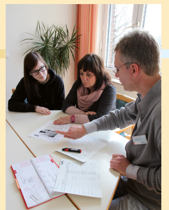
Die Beratung durch einen Sozialarbeiter