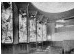
Blik in het interieur van de in 1958 geopende nieuwe synagoge in Minden.

In het midden van de vijftiger jaren ontstonden de eerste plannen voor de bouw van nieuwe synagogen. In Westfalen konden tot 1961 zes synagogen worden ingewijd: Dortmund in 1956, Minden en Gelsenkirchen in 1958, Paderborn in 1959, Hagen in 1960 en Munster in 1961. In 1963 volgde de inwijding van de synagoge in Bielefeld. In Recklinghausen en Detmold ontstonden nieuwe gebedszalen in de gemeentehuizen.