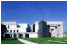
Nieuwbouw van de synagoge van Duisburg, 1998.

De nieuwe gebouwen ontstonden zonder aan te sluiten bij de vooroorlogse synagogen. Men wilde bewust loskomen van de pompeuze monumentale bouwwijze uit het jongste verleden. Functie en techniek bepaalden de bouwwijze. Bovendien was het zaak om, zoals een architect het uitdrukte, "het gemeentelven zodanig te organiseren, dat alle leden konden worden samengebracht en zich naast de godsdienstoefening ook maatschappelijk beter konden leren kennen". Door deze vele verschillende taken leken de nieuwe gebouwen eerder op de gebedshuizen van de gemeenten in lang vervlogen dagen dan op de synagogen van de laatste honderdvijftig jaar.