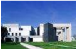
Nieuwbouw van de synagoge van Duisburg, 1998.

De nieuwe gebouwen ontstonden zonder aan te sluiten bij de vooroorlogse synagogen. Men wilde bewust loskomen van de pompeuze monumentale bouwwijze uit het jongste verleden. Functie en techniek bepaalden de bouwwijze. Bovendien was het zaak om, zoals een architect het uitdrukte, "het gemeentelven zodanig te organiseren, dat alle leden konden worden samengebracht en zich naast de godsdienstoefening ook maatschappelijk beter konden leren kennen". Door deze vele verschillende taken leken de nieuwe gebouwen eerder op de gebedshuizen van de gemeenten in lang vervlogen dagen dan op de synagogen van de laatste honderdvijftig jaar.