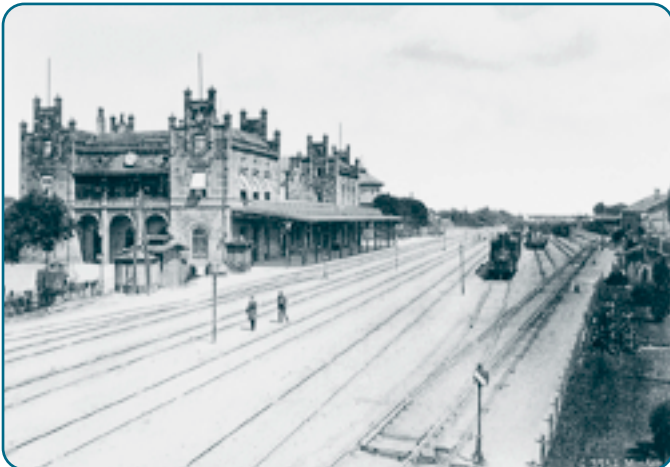
Bahnhof Minden um 1860

→ Bahnhof Minden Der Bahnhof wurde 1847/48 als Endpunkt der Köln-Mindener Eisenbahnlinie erbaut. Die Eröffnung dieser Eisenbahnlinie förderte die Industrialisierung Ostwestfalens ganz entscheidend. Nun konnten Rohstoffe in und Fertigprodukte aus den sich rasch entwickelnden Städten Gütersloh, Bielefeld, Herford und Minden transportiert werden. Der Bahnhof ist als „Inselbahnhof“ angelegt. Das im neugotischen Stil erbaute Empfangsgebäude liegt zwischen den Bahnsteigen von zwei Kopfbahnhöfen. Von Hannover kommend stiegen die Reisenden an der Ostseite des Bahnhofes aus, gingen durch die Zollabfertigung in der Bahnhofshalle und kletterten an der Westseite in die Köln-Mindener Eisenbahn. Der Bahnhof war Teil der neupreußischen Befestigungsanlage der Stadt Minden. An verschiedenen Stellen konnten die Schienen entfernt und Bohlenwände aufgestellt und mit Erde gefüllt werden.