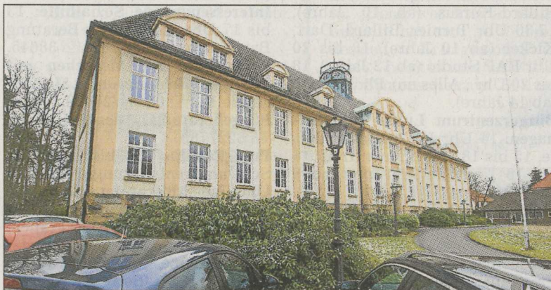
Der ehemalige Verwaltungssitz an der Hermann-Simon-Straße soll zu einem Ambulanzzentrum ausgebaut werden.