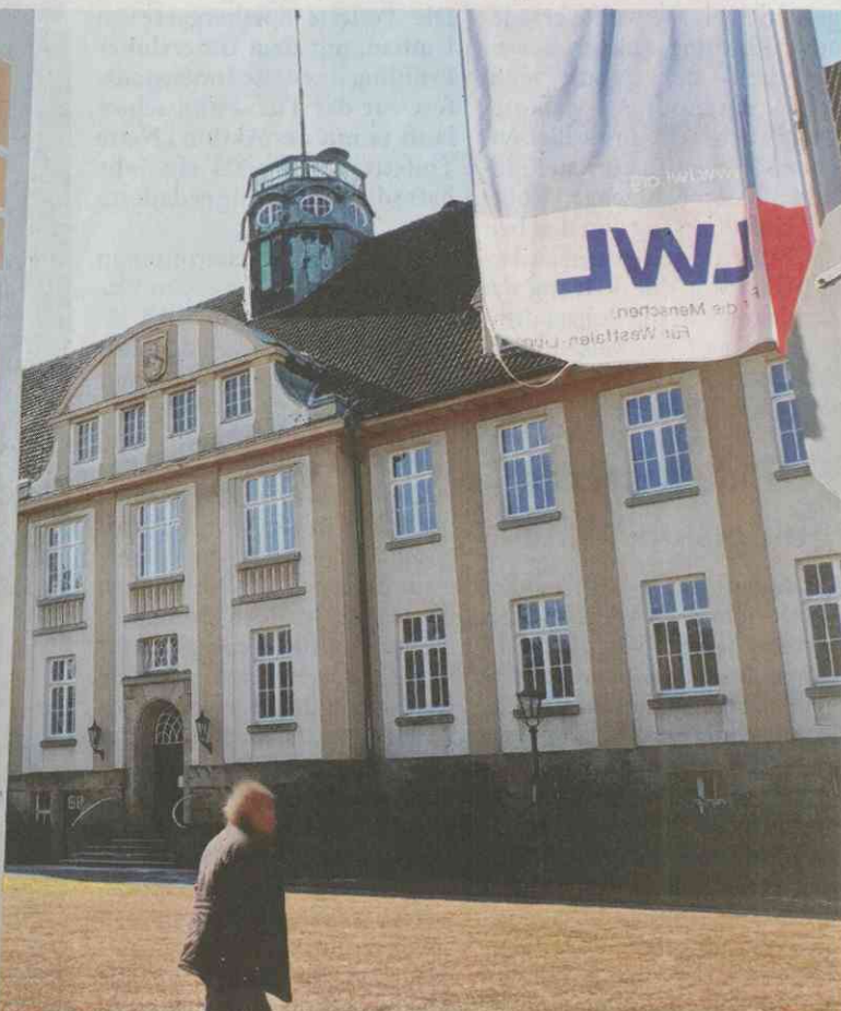
Wird zur zentralen Ambulanz: Der denkmalgeschützte Repräsentativbau vorne an der Hermann-Simon-Straße erfährt eine neue Nutzung. Auf dem Hinweisschild vor dem Gebäude haben wir die Pfeile schon entsprechend ausgerichtet.

saniert und energetisch auf Stand gebracht. Ein Aufzug verbindet alle Etagen barrierefrei. Die Umbaupläne sind mit den Denkmalbehörden in Münster und Gütersloh abgestimmt.