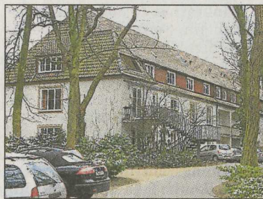
Abriss geplant: Im Haus 3 ist heute die Ambulanz untergebracht.

Eine Außenrampe und eine Stufenanlage sollen einen barrierefreien Weg ins Sockelgeschoss schaffen. Im zentralen Treppenraum ist ein verglaster Aufzug geplant, der alle Ebenen vom Sockel- bis zum Dachgeschoss barrierefrei verbindet und gleichzeitig das Tageslicht bis hinunter in das Sockelgeschoss führt.