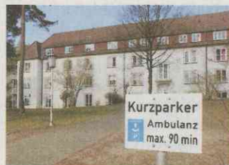
Ein Fall für den Abiss: Haus 3, das ehemalige Personalwohnheim, wird nicht mehr gebraucht.

Auch das Haus 033, bislang Sitz der gerontopsychiatrischen Ambulanz, wird fürs Krankenhaus nicht mehr benötigt. Der LWL prüft eine neue Nutzung, möglicherweise wird es auch vermietet oder verkauft.