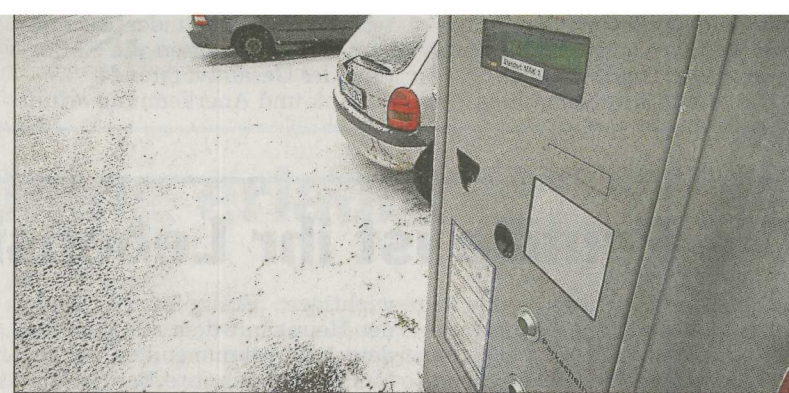
Auch an den Tagesgebühren für den Marktplatz war das Parkraumbewirtschaftungskonzept im Februar gescheitert.

gearbeitet hatte, wegen eines Patts in der Abstimmung überraschend gescheitert. Das Konzept sieht eine Unterteilung des Innenstadtgebiets in drei Parkzonen und eine Ausweitung der Bewirtschaftung auf 360 bisher kostenfreie Parkplätze vor. Am Bahnhof und vor dem Rathaus soll die Mindestgebühr entfallen. Insgesamt rechnet die Stadt – bei gleichbleibenden Gebührensätzen – mit jährlichen Mehreinnahmen in Höhe von 200 000 Euro. Lühr sagte, es habe zwischenzeitlich erklärende Gespräche mit der Politik gegeben. Ein Knackpunkt war zuletzt der Marktplatz.