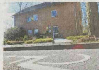
Neue Nutzung gesucht: Haus 33, bislang Sitz der gerontopsychiatrischen Ambulanz.